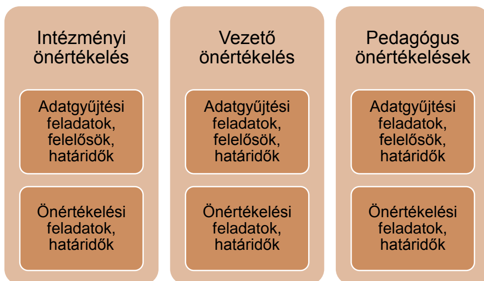
5. sz. ábra. Az éves önértékelési terv ajánlott szerkezete

Az önértékelési programot és az éves önértékelési tervet az intézményvezető vagy az önértékelési csoport erre kijelölt tagja rögzíti az Oktatási Hivatal által működtetett informatikai felületen, amely a tervben rögzítettnek megfelelően teszi elérhetővé az adatgyűjtő és az értékelő funkciókat az értékelésben részt vevők számára.