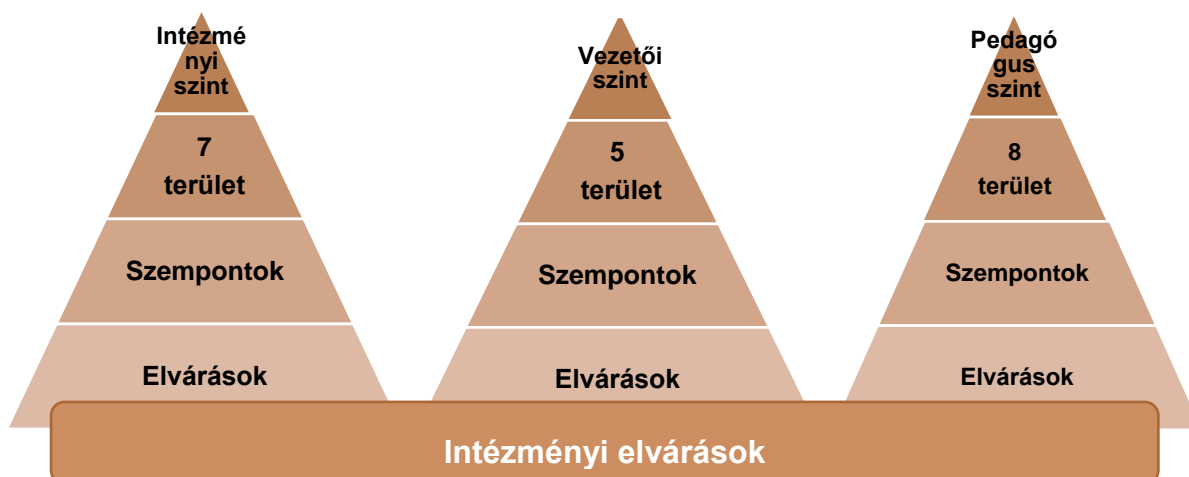
3. sz. ábra. A standard elvárásainak és az intézményi elvárások viszonya